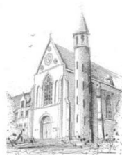
Parochie O.L.V. Onbevlekt Ontvangen Zenderen

Iedereen die rechthebbende is van een graflocatie of urnlocatie op het kerkhof van Zenderen, ontvangt aan het eind van de huurtermijn altijd een brief over de mogelijkheden voor verlengen of ruimen van de locatie.